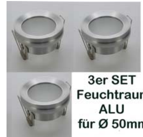
3er SET Feuchtraum ALU für Ø 50mm

3er Pack Feuchtraum-Einbauleuchte aus ALU für Halogen- oder LED Leuchtmittel 50mm. Lieferung inkl. GU10 Keramikfassung. Einfacher Leuchtmittelwechsel durch die abschraubbare ALU Blende. Lieferung ohne Leuchtmittel