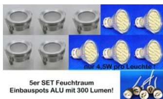
5er SET Feuchtraum Einbauspots ALU mit 300 Lumen!

5er Feuchtraum-Einbauleuchte n SET aus ALU mit LED Leuchtmittel 50mm. Lieferung inkl. GU10 Keramikfassung. Einfacher Leuchtmittelwechsel durch die abschraubbare ALU Blende. Lieferung mit 270 Lumen LED Leuchtmittel