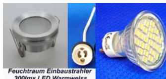
Feuchtraum Einbaustrahler 300lmx LED Warmweiss

1er Feuchtraum-Einbauleuchte n SET aus ALU mit LED Leuchtmittel 50mm. Lieferung inkl. GU10 Keramikfassung. Einfacher Leuchtmittelwechsel durch die abschraubbare ALU Blende. Lieferung mit 270 Lumen LED Leuchtmittel