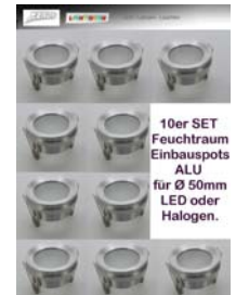
10er SET Feuchtraum Einbauspots ALU für Ø 50mm LED oder Halogen.

10er Pack Feuchtraum-Einbauleuchte aus ALU für Halogen- oder LED Leuchtmittel 50mm. Lieferung inkl. GU10 Keramikfassung. Einfacher Leuchtmittelwechsel durch die abschraubbare ALU Blende. Lieferung ohne Leuchtmittel. Wir empfehlen LED