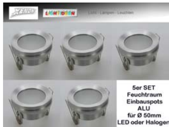
5er SET Feuchtraum Einbauspots ALU für Ø 50mm LED oder Halogen

5er Pack Feuchtraum-Einbauleuchte aus ALU für Halogen- oder LED Leuchtmittel 50mm. Lieferung inkl. GU10 Keramikfassung. Einfacher Leuchtmittelwechsel durch die abschraubbare ALU Blende. Lieferung ohne Leuchtmittel. Wir empfehlen LED Leuchtmittel.