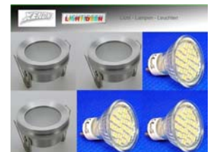
3er SET Feuchtraum Einbauspots ALU mit 300 Lumen!

3er Feuchtraum-Einbauleuchte n SET aus ALU mit LED Leuchtmittel 50mm. Lieferung inkl. GU10 Keramikfassung. Einfacher Leuchtmittelwechsel durch die abschraubbare ALU Blende. Lieferung mit 270 Lumen LED Leuchtmittel