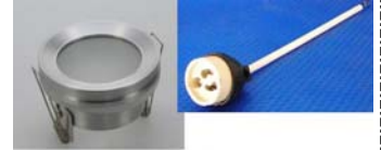
Feuchtraum ALUMINIUM Einbauspott

Feuchtraum-Einbauleuchte aus ALU für Halogen- oder LED Leuchtmittel 50mm. Lieferung inkl. GU10 Keramikfassung. Einfacher Leuchtmittelwechsel durch die abschraubbare ALU Blende. Lieferung ohne Leuchtmittel Wir empfehlen LED Leuchtmittel. Technische Daten: - Anschluß: 230V/50Hz - Sockel: GU10